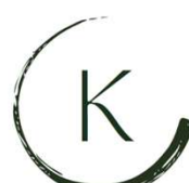
ESSAI DE FREIN