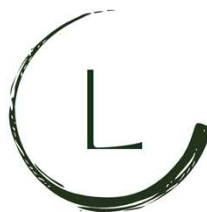
RECONNAISSANCE APTITUDE TRANSPORT